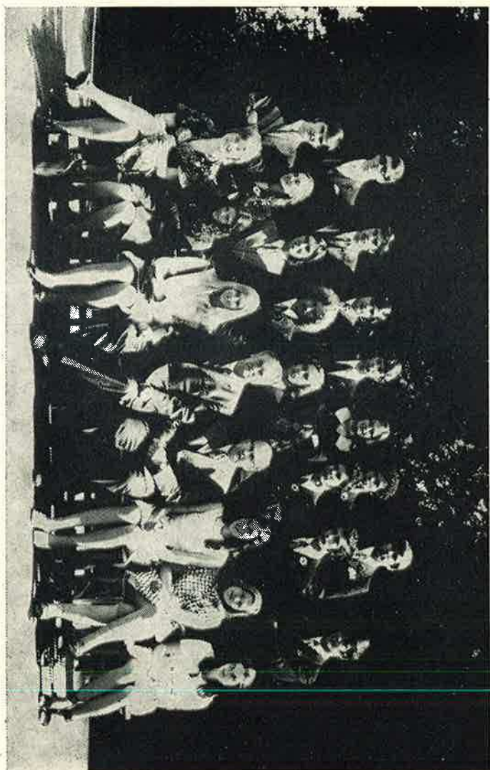
8. b Klasse